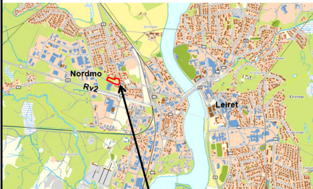
Oversiktskart som viser planområdet