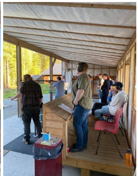
Foto fra leirduebanen i Mo