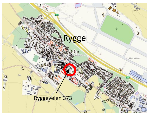
Figur 1. Beliggenhet

Planområdet er ca. 7,2 dekar og ligger ved Ryggevegen på Halmstad i Moss kommune. Oversiktskart som viser lokalisering av området og kartutsnitt med planens begrensning vises nedenfor.