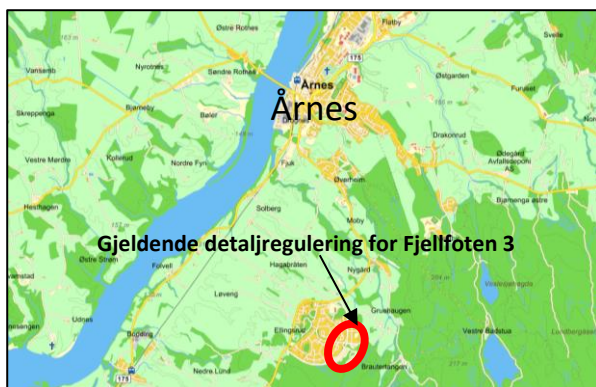
Figur 1. Beliggenhet

Oversiktskart som viser lokalisering av området og kartutsnitt med avgrensning av endringsområdet vises nedenfor.